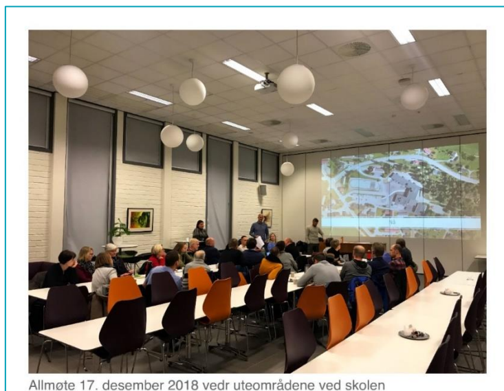
Allmøte 17. desember 2018 vedr uteområdene ved skolen