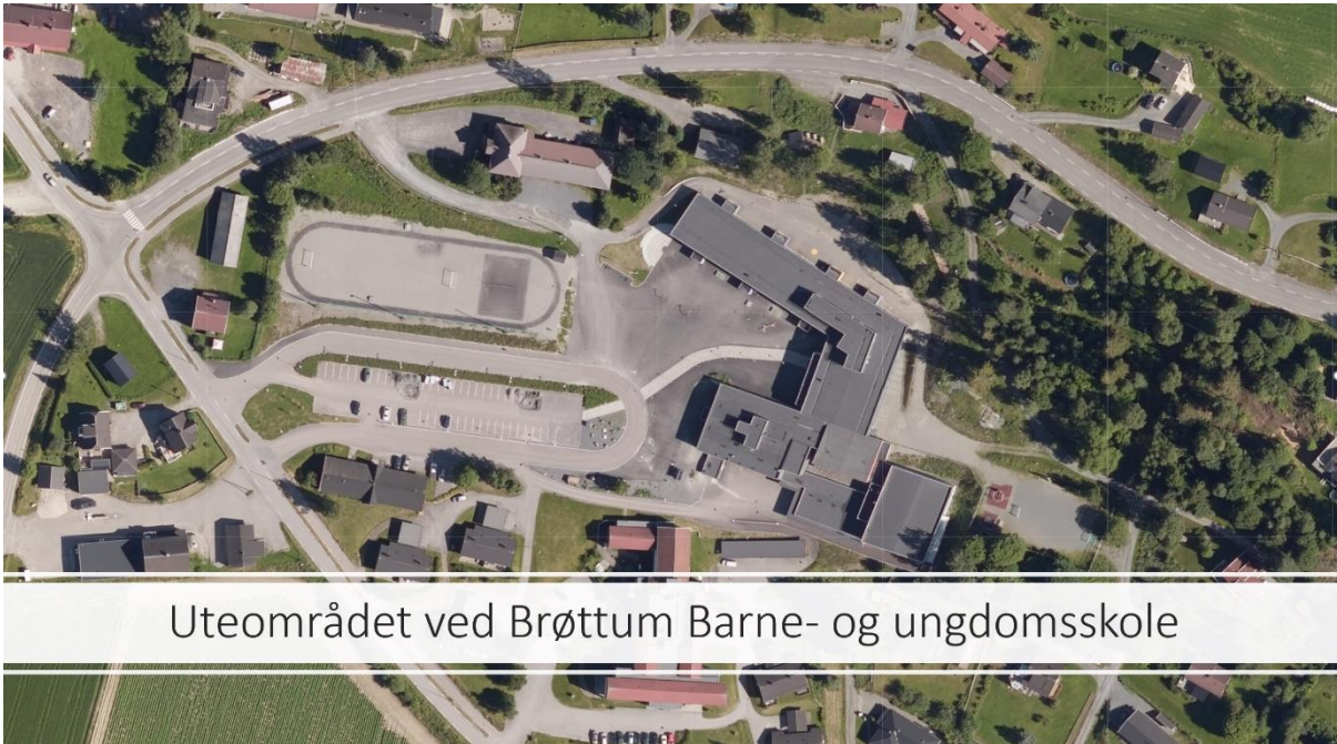
Uteområdet ved Brøttum Barne- og ungdomsskole

ARBEIDSGRUPPEN SOM REPRESENTERER LAG OG FORENINGER I BRØTTUMSBYGDA FOR ETABLERING AV ET GODT NÆRMILJØANLEGG I BRØTTUM SENTRUM